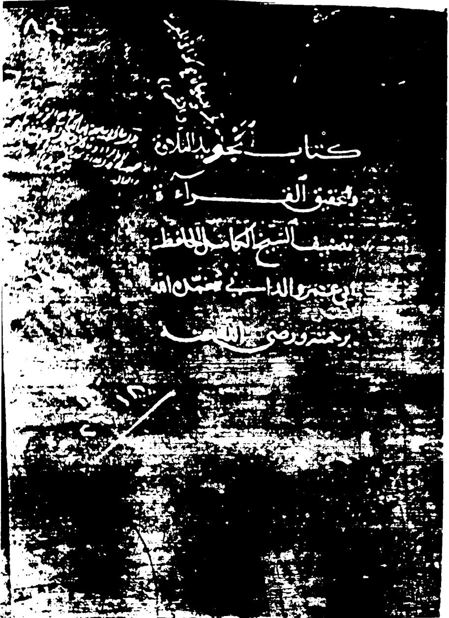
صفحة العنوان في نسخة مكتبة جبار الله