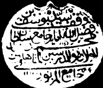
الصفحة الأخيرة من نسخة مكتبة چستريتي