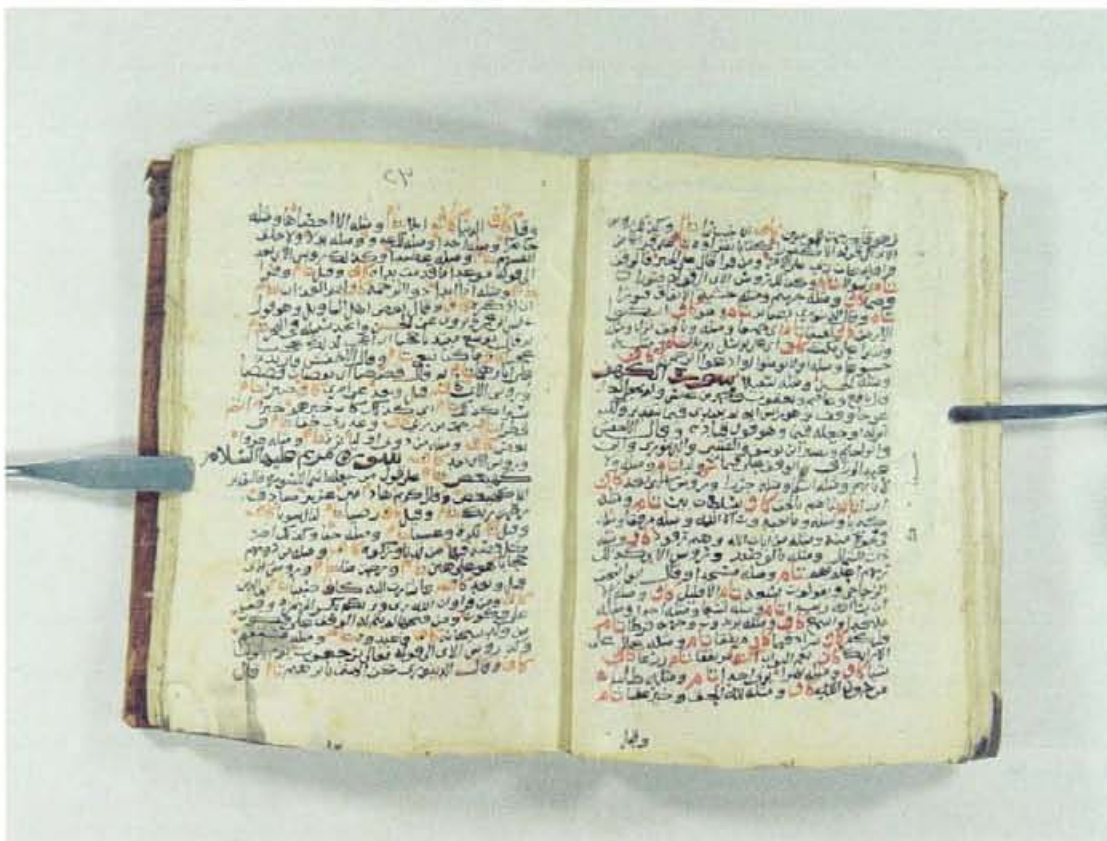
اللوحة الأخيرة - من الجزء المخصص لي - نسخة دار المخطوطات اليمنية (ي)