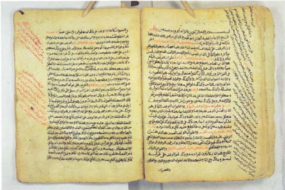
اللوحة الأولى - نسخة جامعة الإمام محمد بن سعود (س)