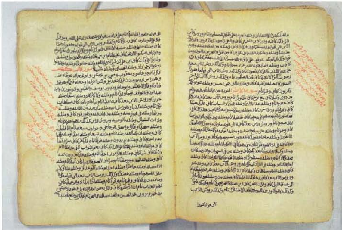
اللوحة الأخيرة - من الجزء المخصص لي - نسخة جامعة الإمام محمد بن سعود (س)