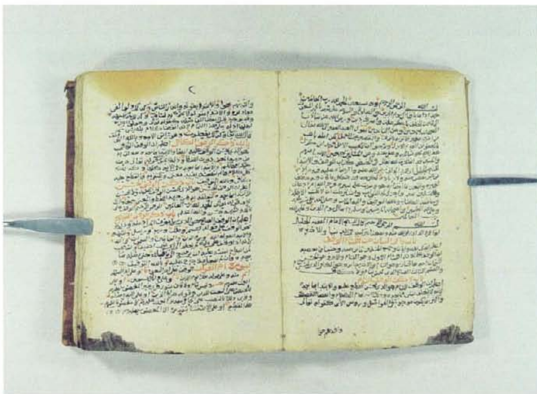
اللوحة الأولى - نسخة دار المخطوطات اليمنية (ي)