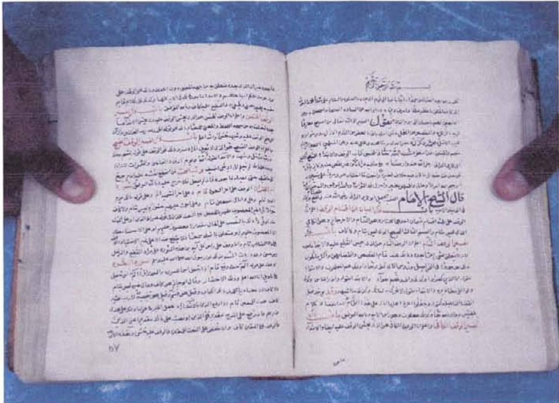
اللوحة الأولى - نسخة الجامع الكبير رقم ٣٠ (ج)