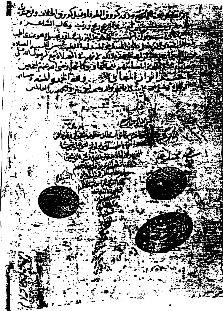
الصفحة الأخيرة من النسخة ( ز )