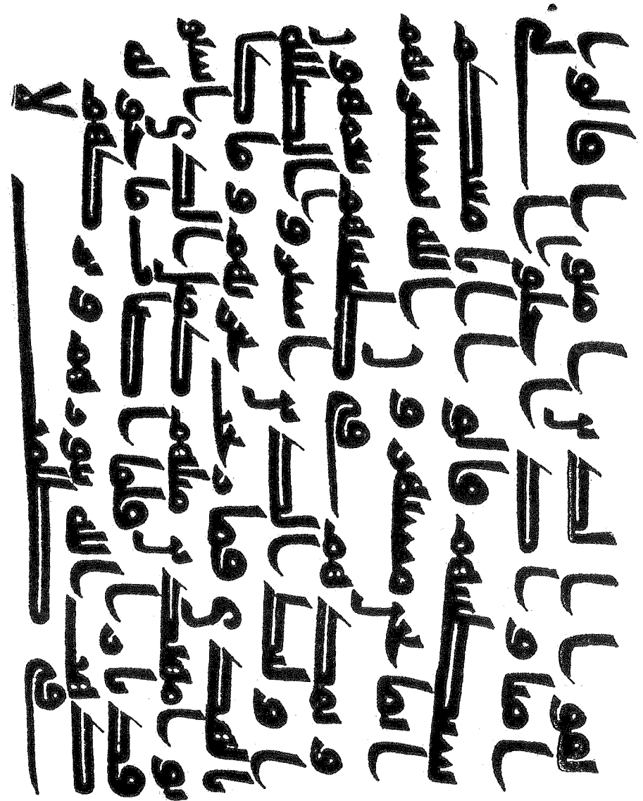
صورة عن صفحة من نسخة المصحف المنسوب إلى سيدنا عثمان بن عفان رضي الله عنه والمحفوظ في مكتبة الإدارة الدينية بطشقند.