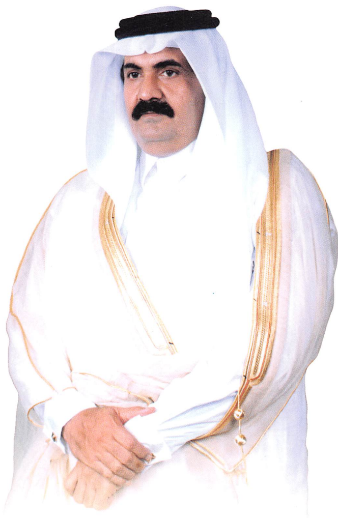
حَضْرَةُ صَاحِبِ السَّمَوِّ السيِّدِ مُحَمَّدِ بْنِ خَالِيفَةَ اللَّهِ تَامِيحُ أَمِيرُ دَوْلَةِ قَطْرُ