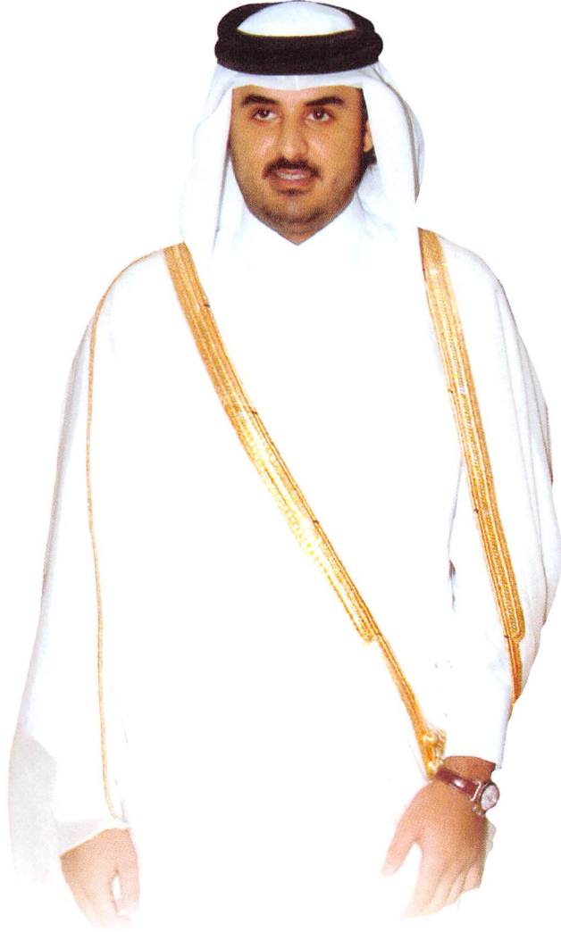
سمو السيخ عيسى بن محمد آل نافي ولي العهد الأمين