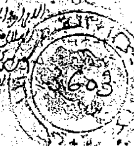
الصفحة الأخيرة من مخطوطة الخزانة الحسينية