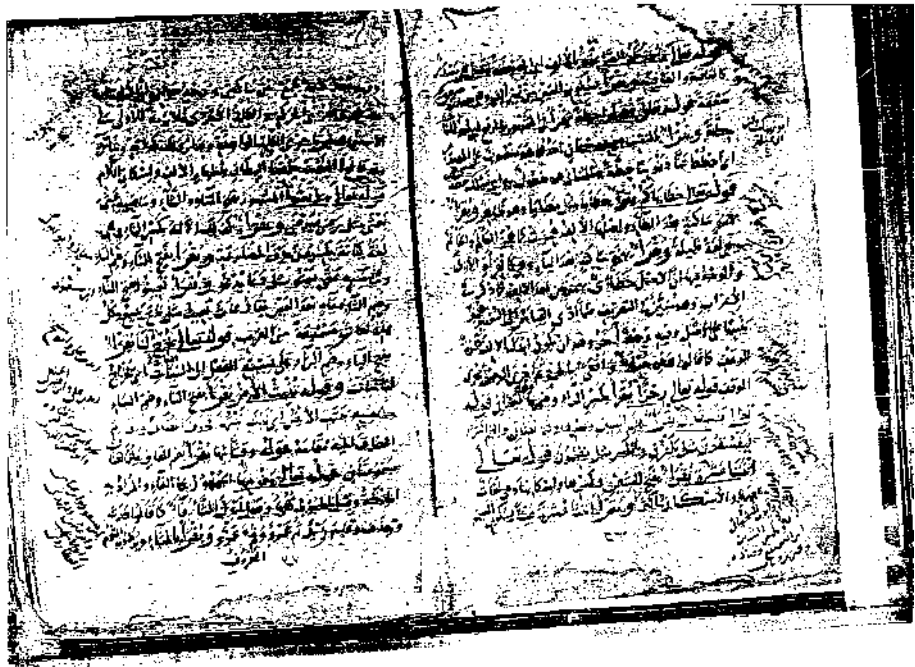
اللوحة (١)، و(١٨) من النسخة الأصلية