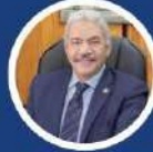
أ.د/ محمود صديق نائب رئيس الجامعة للدراسات العليا والبحوث