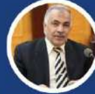
أ.د/ رمضان عبدالله العاوي نائب رئيس الجامعة لوجه البحري

تنظم كلية القرآن الكريم للقراءات وعلومها بطنطا - جامعة الأزهر المؤتمر العلمي الدولي الثاني