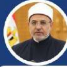
أ.د/ سلامة جمعه داود رئيس جامعة الأزهر