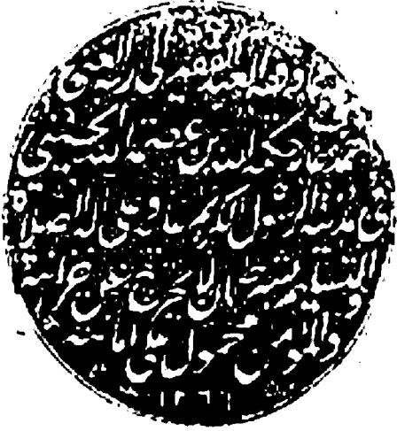
الصفحة الأخيرة من الأصل

فِي هَذَا الْبَابِ جَمِيعَ مَا رَوَى عَنْهُ عَنِ ابْنِ مَسْرُودٍ مِنْ خَطُوطِ الْمُصَاحِفِ مِمَّا أَخَذَتْ بَعْضُ فِرْقَةٍ وَأَيْتًا مِنْ كِتَابِ ابْنِ كَثِيرٍ وَغَيْرِهِ مِنَ الْكُتُبِ وَجَمِيعَةً مِنْ مَبْلَغِ الْجُهْدِ وَالطَّاقَةِ وَاللَّحْمِ الْمُسْتَعَارِ فِي كِتَابِ الْكُنَى وَالْحَمْدُ لِلَّهِ وَحْدَهُ وَصَلَّى اللَّهُ عَلَى سَيِّدِنَا مُحَمَّدٍ نَبِيِّهِ وَعَلَى آلِهِ الطَّاهِرِينَ وَعَلَى أَهْلِ بَيْتِهِ الْمُتَّحِينَ وَعَلَى أَرْوَاحِهِمُ الْمُقَاتِلِينَ الْمُؤْمِنِينَ وَسَلَامٌ عَلَيْهِمْ وَسَلَامٌ وَكُنْتُ لِحَدِيثِ مُحَمَّدٍ مُحَمَّدِ بْنِ أَحْمَدَ بْنِ الْقُرْبِيِّ الْأَنْدَلُسِيِّ فِي قَلْبِهِ لِعِزِّهِ الْعَشْرَ الْأَخْرَسَ مِنْ صَفِيحَتِهِ عَلَى وَجْهِ طَلْحَاءِ بْنِ نَفْعَانَ النَّبَسِيِّ وَلَا حَوْلَ وَلَا قُوَّةَ إِلَّا بِاللَّهِ الْعَلِيِّ الْعَظِيمِ حَسْبُكَ اللَّهُ وَبِعِزِّ الْوَكِيلِ