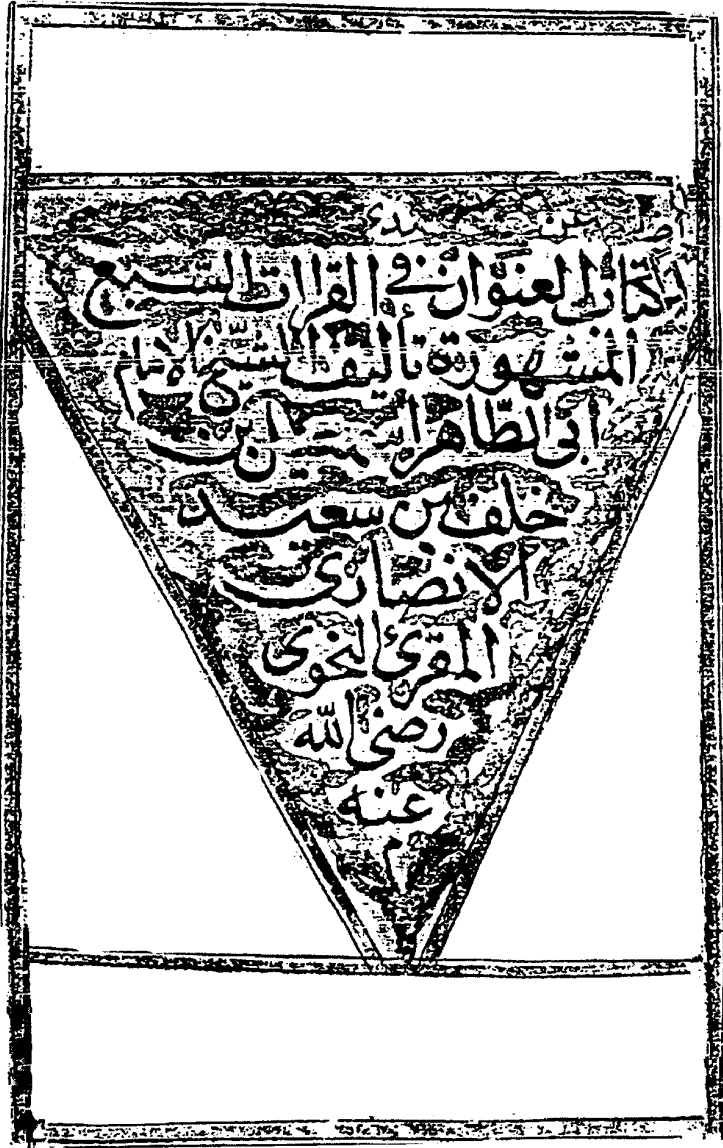
صفحة العنوان من كتاب العنوان ( وهو مختصر الاكتفاء )