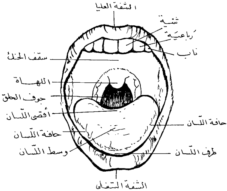
شكل رقم (١) مقطع يوضح بعض أجزاء الفم والحلق واللسان

اقتبس هذا الشكل من كتاب «حق التلاوة» ص ٢١٤ بتصرف